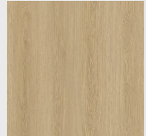
LOFTEN OAK NO.7331-2-1-R2