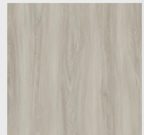
MAPLE LUXE NO.7331-2-1-R2