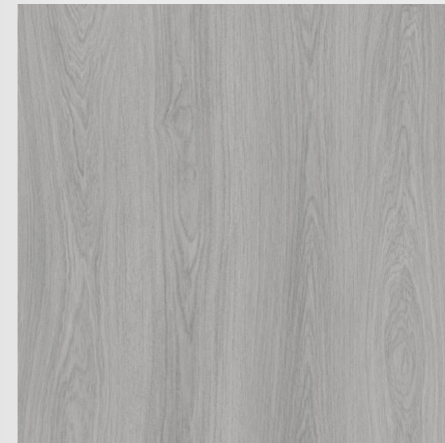
ASHTON WOOD NO.7331-2-1-R2